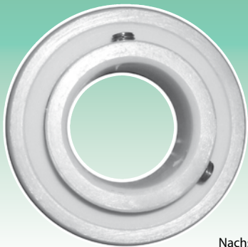
Nachsetzzeichen UNF: Zollabmessungen der Befestigungsstifte Суффикс UNF: Дюймовые размеры установочных винтов